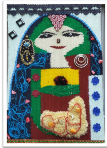
اسم الطالب / امل ابوصالح علي السيد

الخامات : خيوط صوف ملونة - حلقات معدنية - احجار ملونة - اكسسوارات التقنيات : تابستري - مبرد - وبرة معقودة