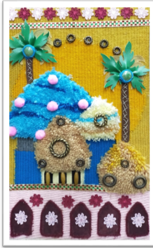
اسم الطالب / امل مسعد ابراهيم